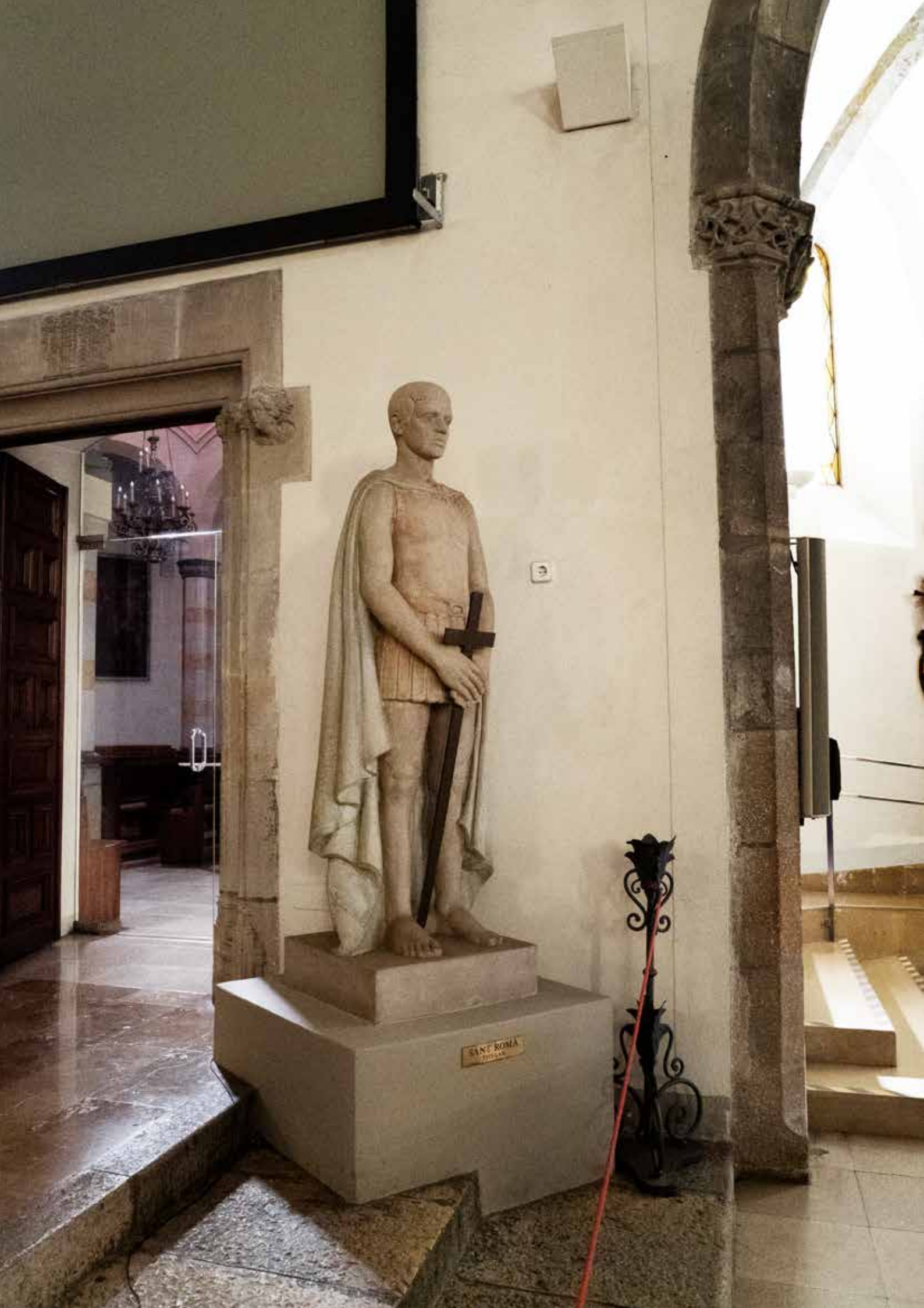
SANT ROMÁN 1710-18